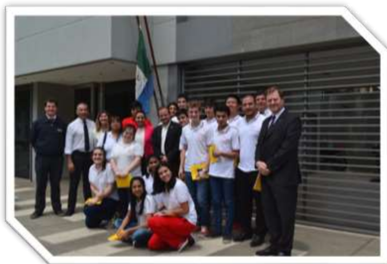
Visita Institucional de Establecimiento Educativo Secundario

Por ello, continuar con la implementación de estas actividades y propuestas permitirá perseverar en el trabajo en pos de un Poder Judicial idóneo, sensible, abierto y transparente que permita recobrar en lo cotidiano la vigencia efectiva de los derechos humanos.