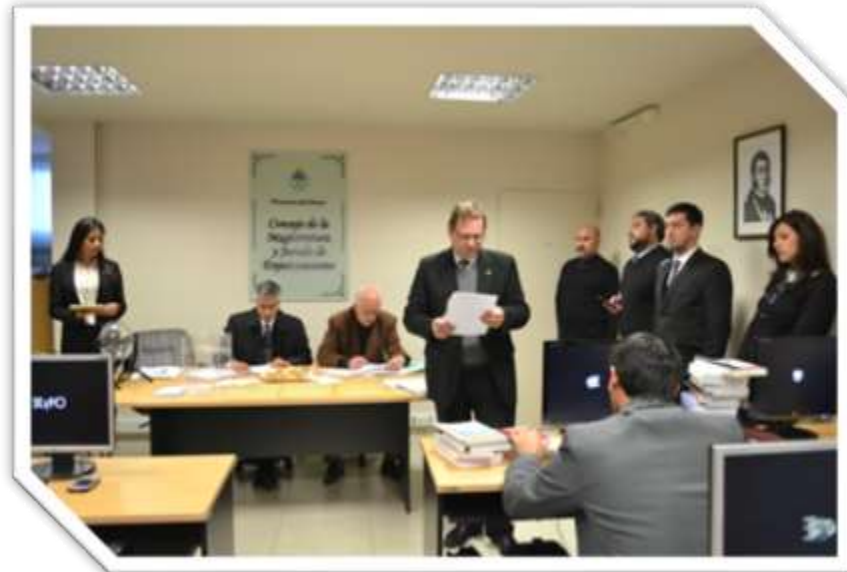
Examen Escrito - Concurso de Oposición

determinado; d) Los libros menores que a los efectos administrativos y de control sean necesarios.”, sin detalle de quién es la persona encargada de hacerlo, por lo que, entiendo, en principio, le debe hacer el Secretario General.