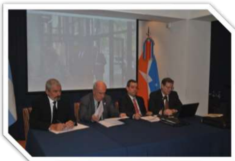
Jornadas Nacionales del Fo.Fe.C.Ma en Usuhia – Año 2014

fueron consejeros chaqueños. Del mismo modo, en el trasuntar del tiempo obtuvieron las secretarías, vocalías, etc. Actualmente el Consejo de la Magistratura del Chaco tiene a su cargo la Tesorería del foro con la existencia de una cuenta corriente que se halla en el “Nuevo Banco del Chaco” y asistido por un profesional contable de la ciudad de Resistencia como así también su apoderado para los trámites correspondientes, recae en que elabora el presente proyecto, ello en virtud de su condición de “Miembro Honorario” de dicho foro, siendo el primer secretario de un consejo distinguido con tan honorable distinción.