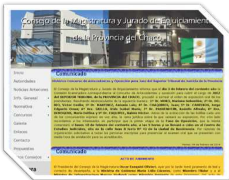
Sitio Web Institucional

La política que se sigue es “puertas y cajones siempre abiertos”, lo que nos da la posibilidad de la máxima divulgación y conocimiento de los documentos y elementos de trabajo, salvo los que, excepcionalmente se encuentran bajo llave a cargo del suscripto.