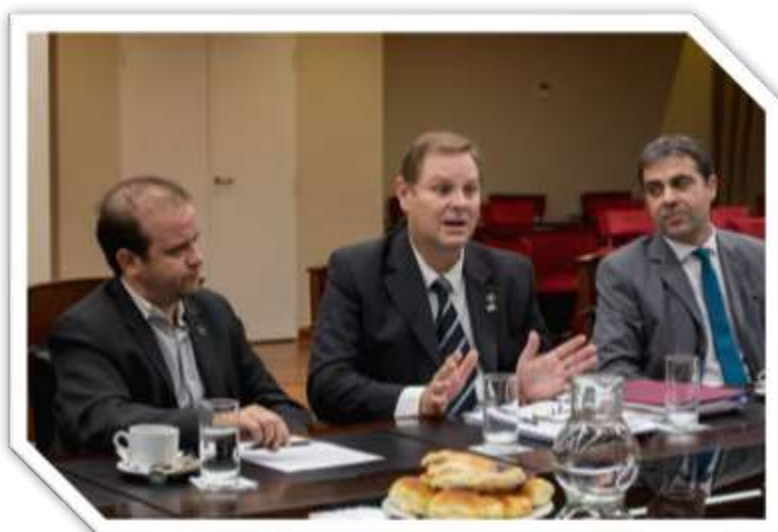
Reunión del Comité Ejecutivo del Fo.Fe.C.Ma